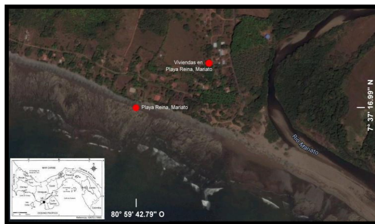
Figura 1. Coordenadas de la ubicación de playa Reina, Mariato, provincia de Veraguas, figura tomada de Google Earth (2016).

Playa Reina está ubicada en el Golfo de Montijo, que es un estuario bajo y fangoso alimentado en su extremo norteño por dos ríos; la mayoría de los lugares tienen menos de 10 metros de profundidad. Son un conjunto de varias islas boscosas, en medio de lo mangles del golfo, a lo largo de los bancos del río en su extremo superior. El sector de Mariato, donde se encuentra esta playa, está ubicado a 7°37'16.99" LN y 80°59'42.79" LO (Figura 1), su superficie es de 313 Km 2 ; sus costas son irregulares. Consta de muchas playas, pero la más sobresaliente es la Reina, que tiene muy pocas secciones arenosas, un extenso litoral rocoso y el agua es muy turbia llena de sedimentos.